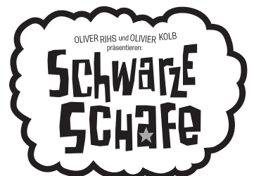
Motiv 9b: 45 x 33 mm