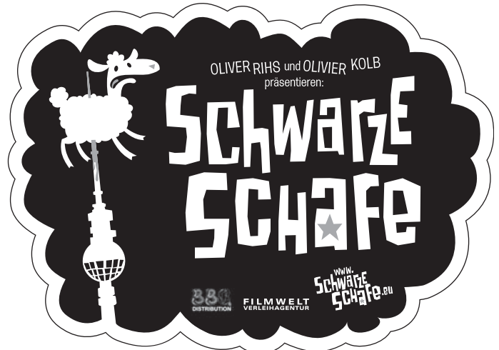
Motiv 4: 90 x 65 mm