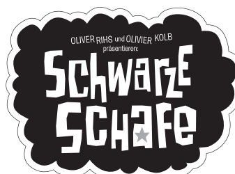
Motiv 9a: 45 x 33 mm