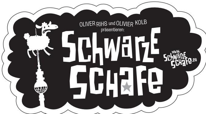
Motiv 5: 90 x 50 mm