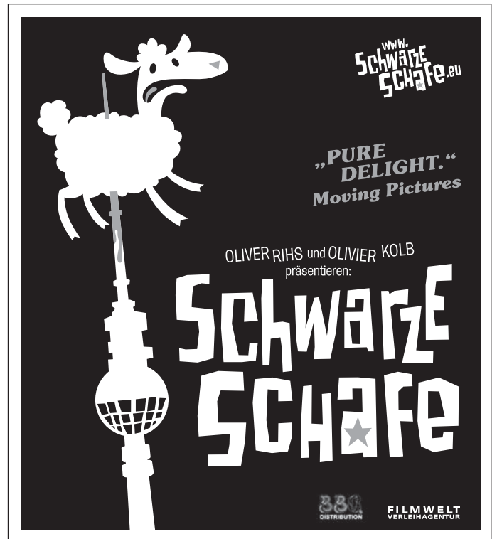
Motiv 2: 90 x 100 mm