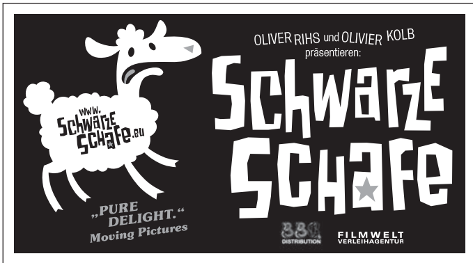
Motiv 3: 90 x 50 mm