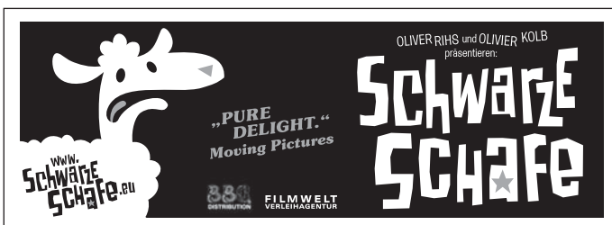
Motiv 8: 90 x 33 mm