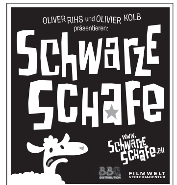
Motiv 7: 45 x 50 mm